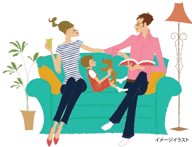
イメージイラスト